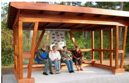
Warte- und Schutzhütte vor dem Haus Waldeck - eine Spende des Fördervereins -

Zum Einen ergänzt und bereichert der Förderverein durch Anschaffungen aus Einnahmen das Angebot und die Ausstattung des Altenwohn- und Pflegeheimes.